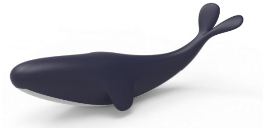
图 3：鲸鱼模型（以比赛现场实物为准）

机器人沿引导线至救助搁浅鲸鱼区域，将搁浅区的鲸鱼（模型大小为 180 \times 60\text{mm} ，如图 3）移动到深海区（鲸鱼模型与地图接触面需完全在地图深海区的背景上）。